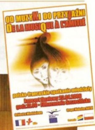
Lors du concert entre jeunes polonais et jeunes lillois, un échange musical et de sympathie.